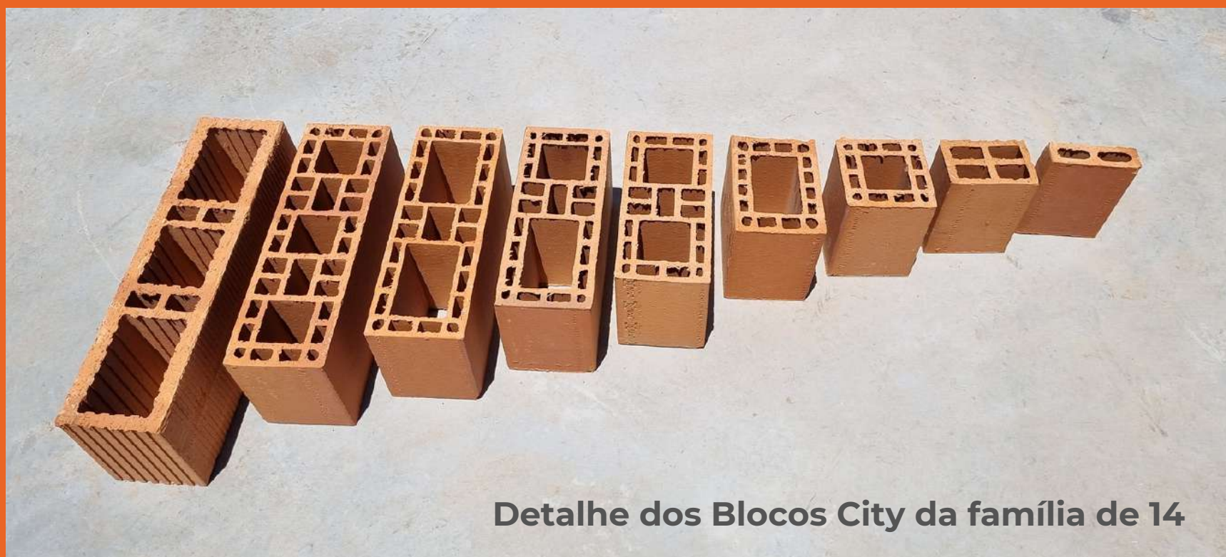
Detalhe dos Blocos City da família de 14

A racionalização da execução da obra é um tema central na busca da otimização e respeito às relações sustentáveis da indústria da construção civil.