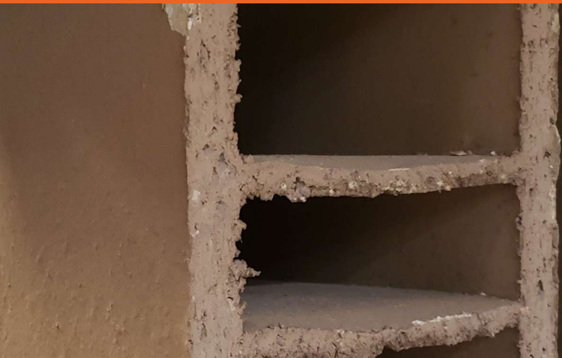
Detalhe de Canaleta City